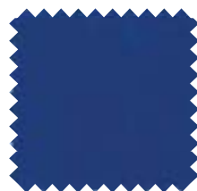
073 Azul Europa Ancho: 2,50 / 3 m