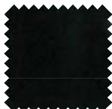
090 Negro Ancho: 2,50 m