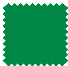
165 Verde Ancho: 2,50 m