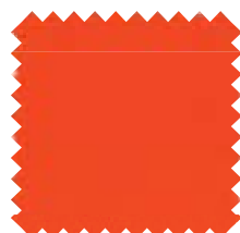
567 Quisquilla Ancho: 2,50 m