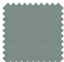
096 Gris Oscuro Ancho: 2,50 m