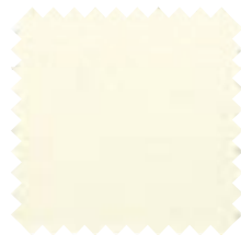
005 Marfil Ancho: 2,50 / 3 m