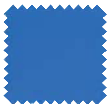
174 Azul Ancho: 2,50 / 3 m