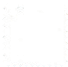
099 Blanco Ancho: 2,50 / 3 m