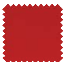
082 Rojo Oscuro Ancho: 2,50 m