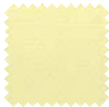
004 Crema Ancho: 2,50 m