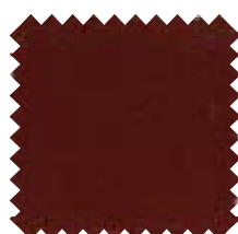
179 Granate Ancho: 2,50 / 3 m