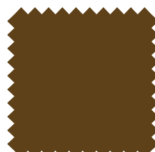
156 Marrón Ancho: 2,50