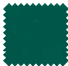
166 Verde Ancho: 2,50 / 3 m