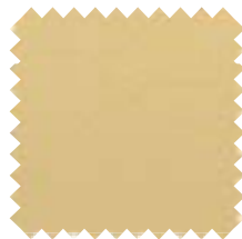
158 Beige Ancho: 2,50 / 3 m