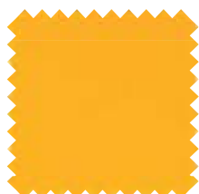
555 Amarillo Oscuro Ancho: 2,50 m