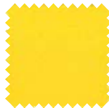
036 Amarillo Ancho: 2,50 m